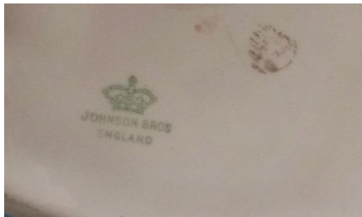
Detalhe da marca ao fundo do vaso pertencente ao acervo do Museu da Casa Brasileira Transcrição: JOHNSON BROS / ENGLAND