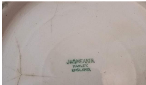
Detalhe da marca no fundo da bacia pertencente ao Acervo do Museu da Casa Brasileira Transcrição: J&G MEAKIN. / HAMLEY / ENGLAND